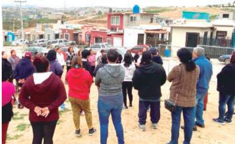
ENSENADA.- Ciudadanos recibieron información sobre seguridad comunitaria y programas de prevención de la violencia.