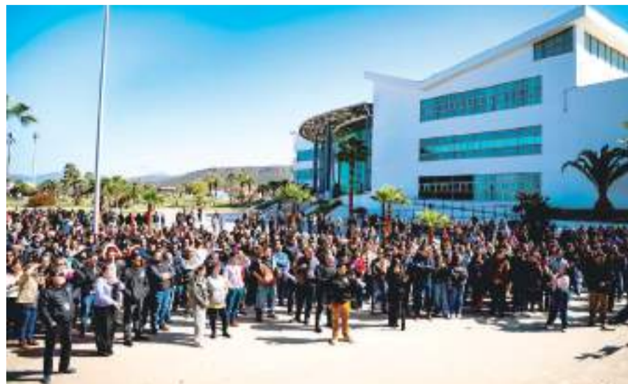
ENSENADA.- El Ayuntamiento de Ensenada se sumó al Macrosimulacro, con motivo de los 15 años del sismo ocurrido en la capital del Estado.

Refirió que este ejercicio se da para recordar las acciones que deben llevarse a cabo en caso de sismo, como el ocurrido en Mexicali, de magnitud 7.2, el 4 de abril de 2010.