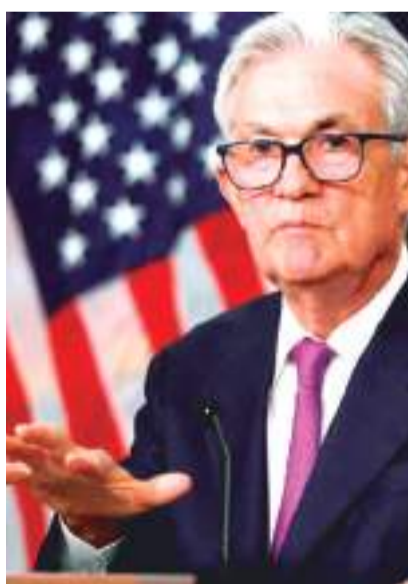
Jerome Powell, presidente de la Reserva Federal de Estados Unidos.