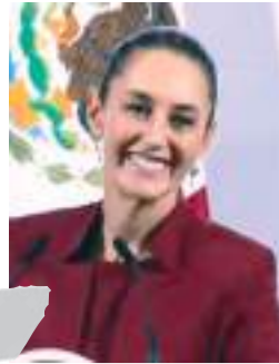
MEXICALI CLAUDIA SHEINBAUM PARDO...

Logra acuerdos en materia de seguridad con empresarios de bares y restaurantes.