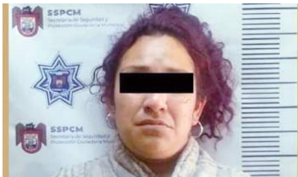
TIJUANA.- Anayeli "N", de 30 años, era considerada objetivo prioritario en la mesa de seguridad por ser generadora de violencia en Valle Verde, demarcación La Presa.

Gracias a la labor de los agentes fue que se logró el aseguramiento sin incidentes, donde le decomisaron una bolsa de plástico con 13 "globos con cristal". La detenida y la sustancia confiscada fueron puestas a disposición de la autoridad correspondiente para continuar con las investigaciones.