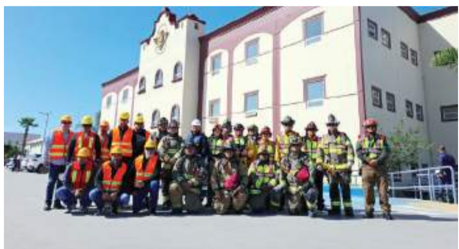
PLAYAS DE ROSARITO.- De exitosa fue calificada la participación de servidores públicos y ciudadanos, en el ejercicio del Macro Simulacro Estatal de Sismo.

Finalmente, el activista precisó que el predio intervenido también cuenta ahora con un paso peatonal y nuevos árboles que ofrecerán sombra en el futuro, “sin duda, un espacio que no solo es visualmente atractivo, sino funcional y sustentable”, concluyó. (scg)