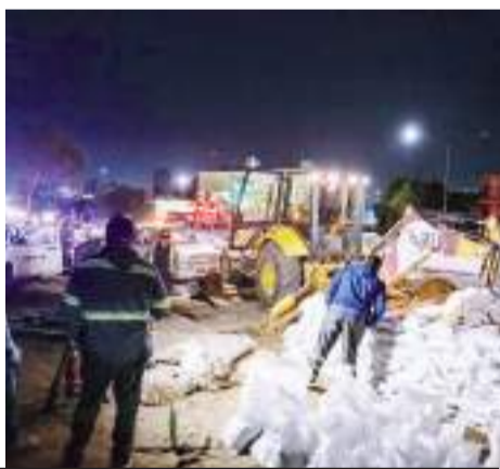
TIJUANA.- El ebrio conductor se trasladaba en un vehículo compacto a toda velocidad sobre la Internacional; le hallaron una chamarra del ayuntamiento.