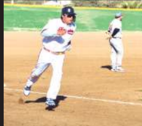
Nacionalistas y Veterinaria Bahía inician la lucha final por los máximos honores.