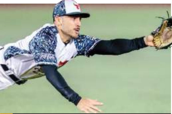
Isaac necesita veinte hits para convertirse en el primer jugador en la historia del club con 800 imparables.

Isaac necesita veinte hits para convertirse en el primer jugador en la historia del club con 800 imparables. Requiere de 24 carreras empujadas más para ser el primero con trescientas en la organización y once robos para llegar a 150, otra cifra que también es la máxima de la franquicia.