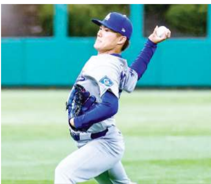
Dodgers vio cortado su inicio perfecto de campaña.

Con los Filis arriba por 1-0 en la séptima entrada, Luzardo (2-0) se encontró con su único aprieto del juego cuando tenía dos corredores en base con dos outs. El lanzador, cuya recta rebasó las 95 mph, logró que el boricua Kiké Hernández se ponchara con un slider, lo que desató la ovación por parte de una mul-