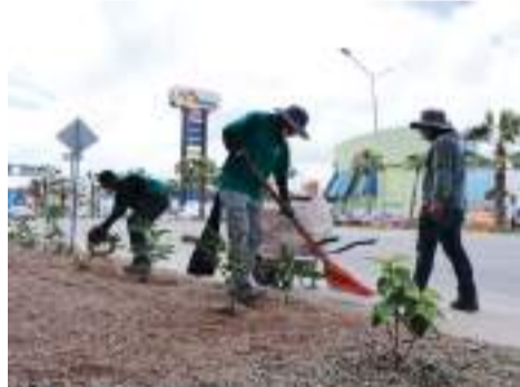
TIJUANA.- Más de 3 mil pinos navideños fueron convertidos en “Mucho Mulch” para mejorar áreas verdes en Tijuana.

El objetivo es mejorar áreas verdes y promover la infiltración de agua en Tijuana con el uso de “Mucho Mulch”