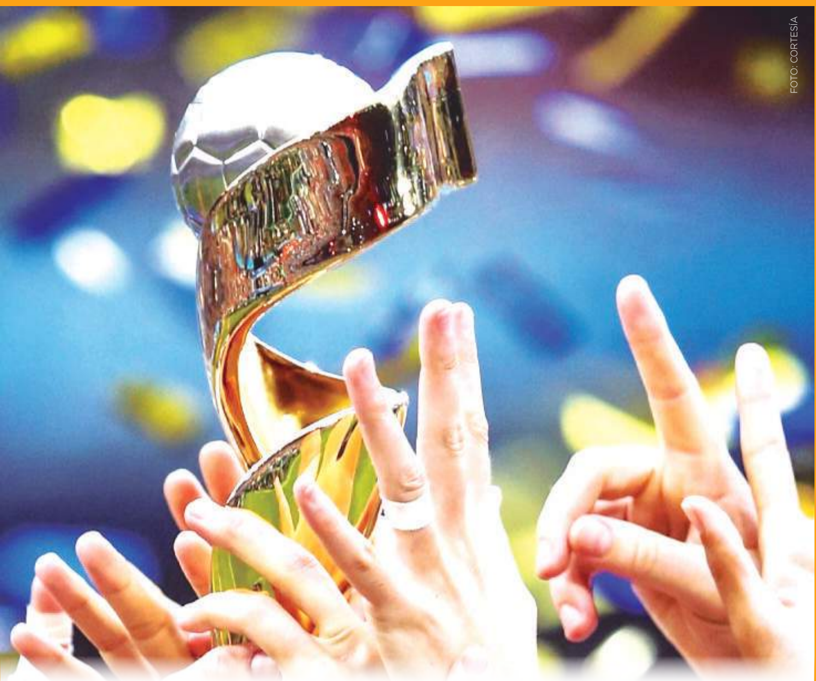
La administración de la FIFA llevará a cabo un exhaustivo proceso de presentación.

El desafiante recorrido de 250.06 millas comenzará y terminará en El Malecón de San Felipe. Se espera que los vehículos de cuatro ruedas más rápidos completen la travesía en aproximadamente cuatro horas, mientras que las motocicletas lo hagan en un tiempo estimado de cinco horas. Todos los competidores tendrán un límite de 12 horas para recorrer las 250.06 millas y así convertirse en finalistas oficiales de esta icónica carrera.