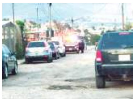
ENSENADA.- De inmediato, los oficiales solicitaron el apoyo de paramédicos, pero el hombre ya no presentaba signos vitales.