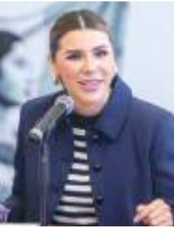
MEXICALI MARINA DEL PILAR ÁVILA OLMEDEA...

Unifica los municipios por la seguridad.