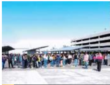
MEXICALI.- Más de 745 mil personas de instituciones públicas, privadas, educativas y de emergencia en los siete municipios del Estado participaron en el macrosimulacro.

Este simulacro tuvo como hipótesis un sismo de magnitud 7.2, similar al ocurrido en 2010, y bus-