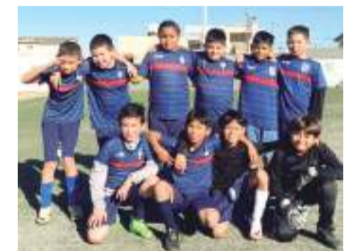
Este sábado y domingo continúan las acciones del Torneo Juvenil y Libre varonil.