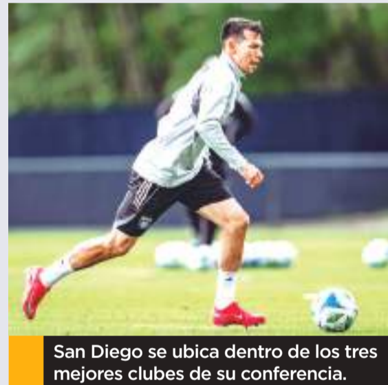
San Diego se ubica dentro de los tres mejores clubes de su conferencia.

Por su parte Seattle ha tenido un arranque complicado en la actual campaña de la Major League Soccer que lo mantiene en el déci-