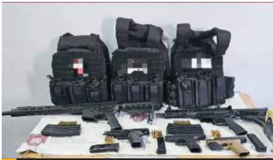
TIJUANA.- Los detenidos y el poderoso armamento quedaron a disposición de la FGR, con sede en esta ciudad.

La detención deriva del operativo que se realizó con el apoyo de la fuerza la Unidad Canina K9 y de la unidad de video vigilancia, quienes de manera coordinada lograron trabajar en la ubicación y detención de quienes son considerados generadores de violencia en nuestra ciudad.