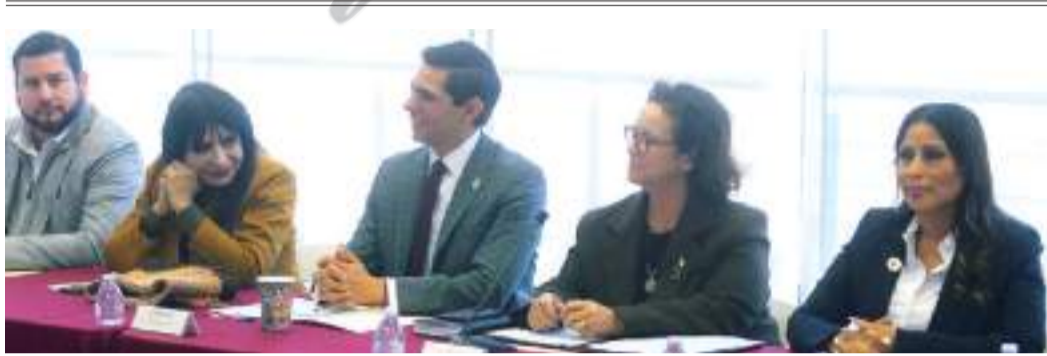
ENSENADA CLAUDIA Y ALCALDES...

En el marco del Macrosimulacro Estatal 2025, la Coordinación Estatal de Protección Civil ( CEPC ) implementó con éxito la metodología CERO (Censo Estatal y Respuesta Operacional) en las instalaciones de la Universidad Autónoma de Baja California ( UABC ) campus Tijuana, como parte de las acciones para fortalecer la preparación y respuesta ante emergencias en espacios educativos.