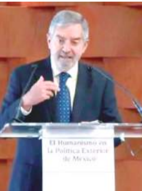
Secretario de Relaciones Exteriores, Juan Ramón de la Fuente.