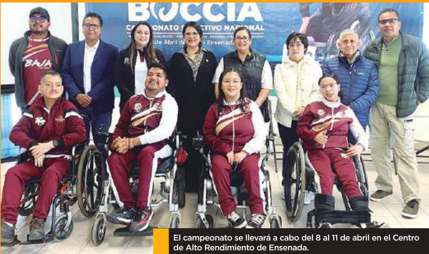
El campeonato se llevará a cabo del 8 al 11 de abril en el Centro de Alto Rendimiento de Ensenada.

golazoderampa@gmail.com www.facebook.com/fufeac Cel: 646 113 65 74