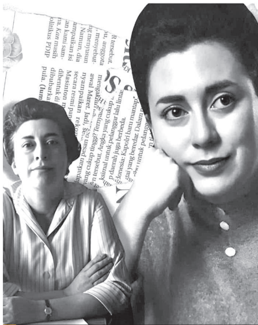
Rosario Castellanos (1925-1974).

Rosario Castellanos. Archivo inédito. Un cielo sin fronteras. 1925-2025 se organiza en cuatro núcleos temáticos: “Su modo de ser río, de ser aire (1925-1938)”, que explora su infancia y su adolescencia temprana en Chiapas; “Yo ya no espero, vivo (1939-1947)”, que abarca su vida entre los 14 y los 22 años; “Mujer de palabras (1948-1957)”, que se enfoca en sus inicios profesionales, su vocación literaria y la publicación