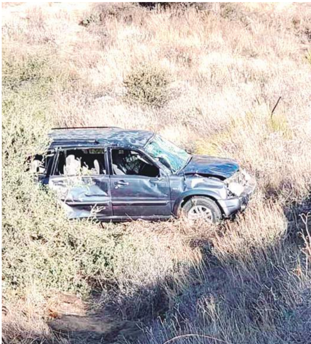
ENSENADA.- Viajaban 9 integrantes de una familia cuando volcaron su camioneta, dejando como saldo un hombre sin vida.

Tras el accidente, un hombre fue declarado sin signos vitales, mientras que los demás tripulantes requirieron traslado a una clínica local para valoración médica.