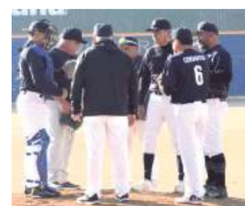
Yankees, con dos ganados y sin derrota, se medirá a Veterinaria Bahía, que llega con dos derrotas.