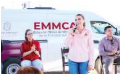
MEXICALI MARINA DEL PILAR...

Fue nombrado tesorero de la Unión Ciclista de México.