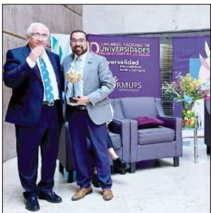
TIJUANA.- Buscan que más planteles se certifiquen como Universidades Promotoras de la Salud.

Manifestó que los exámenes de control y confianza deben ser de un año, y quien resulte reprobado, de manera inmediata ser expulsado de la corporación.