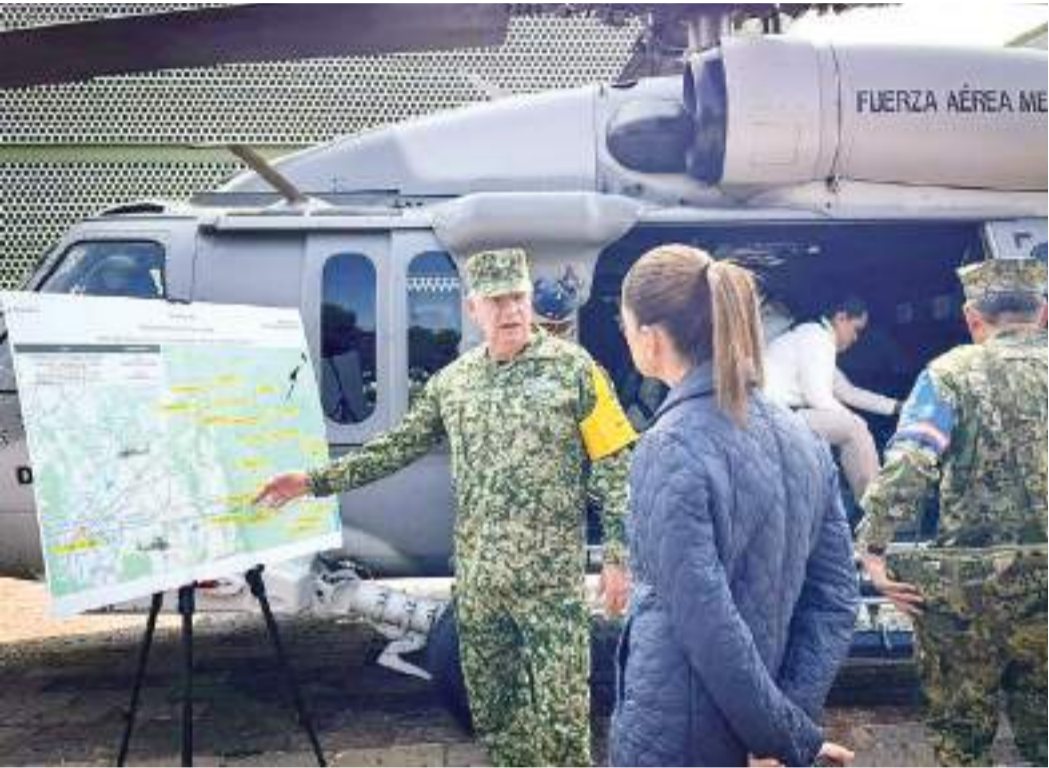
MEXICALI CLAUDIA SHEINBAUM...