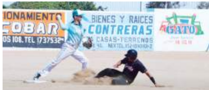
Linestar se quedó con el primer triunfo de la serie final del Torneo de Invitación 2025 de la Liga Urbana de Beisbol de Chapultepec.