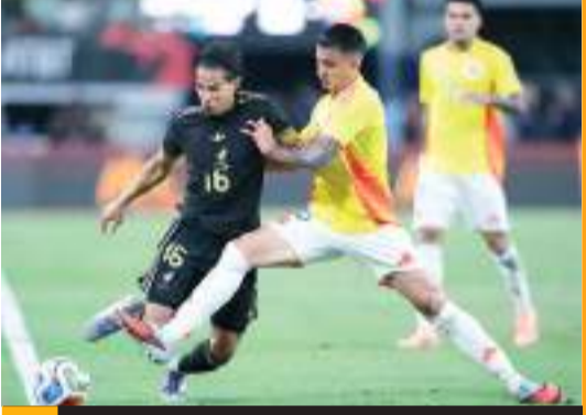
La Selección Mexicana cayó por 4-0 ante Colombia la noche del sábado en cotejo amistoso.

“A la gente le puedo decir que lo siento profundamente, que no me gustó, que es doloroso, uno lo siente, se pone en los zapatos de ustedes y el daño es mayúsculo. A esta distancia del Mundial tengo que ser positivo, animar a mis jugadores, auto-crítico, hoy me equivoqué en algunas cosas”, reconoció Aguirre. El “Vasco” habló también sobre el trabajo en cancha y lo que el equipo debe cambiar para lograr competir ante las selecciones de élite. “(Mi mayor preocupación es) el funcionamiento. Todo lo que hoy yo comento puede sonar a cualquier cosa y asumo mi responsabilidad. Los cuatro goles que nos hicieron son evitables, no se puede ser tan poco competitivo en algunas fases del juego. No quiero puntualizar, el principal responsable soy yo”, afirmó Aguirre. “Hay situaciones que tenemos que mejorar si queremos entrar en la élite, hoy nos enfrentamos ante un equipo colom-