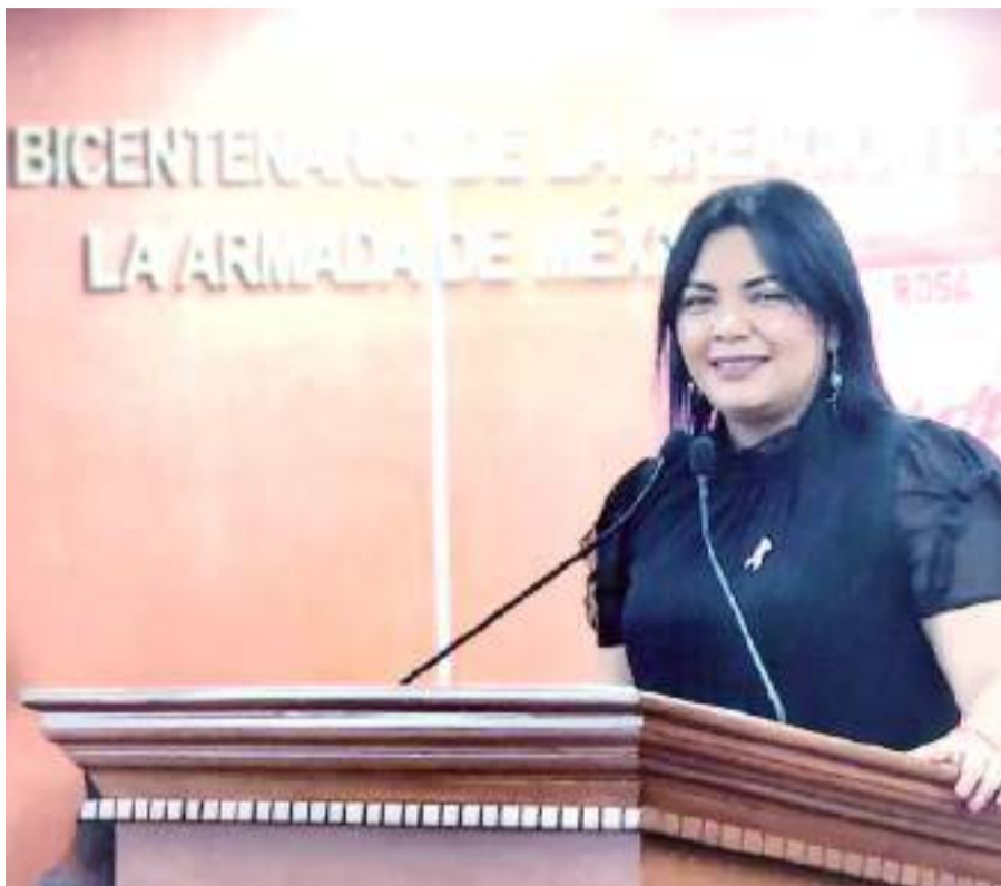
MEXICALI.- Una iniciativa presentada por la Diputada Montserrat Murillo propone que quienes ejerzan la guardia, tutela o custodia vigilen el uso de la TI en niñas, niños y adolescentes.

A este fenómeno, son especialmente vulnerables los niños, puesto que su uso excesivo, los expone