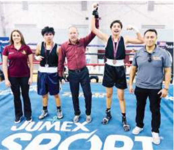
El evento reunió a talentos del boxeo amateur provenientes de distintos gimnasios y clubes de la localidad.

Asimismo, el funcionario reconoció el esfuerzo de los organizadores y entrenadores que contribuyen a la formación de nuevos talentos, al tiempo que reiteró el compromiso del Imdet de continuar respaldando programas y proyectos deportivos que promuevan la inclusión y la participación comunitaria en todas sus disciplinas.