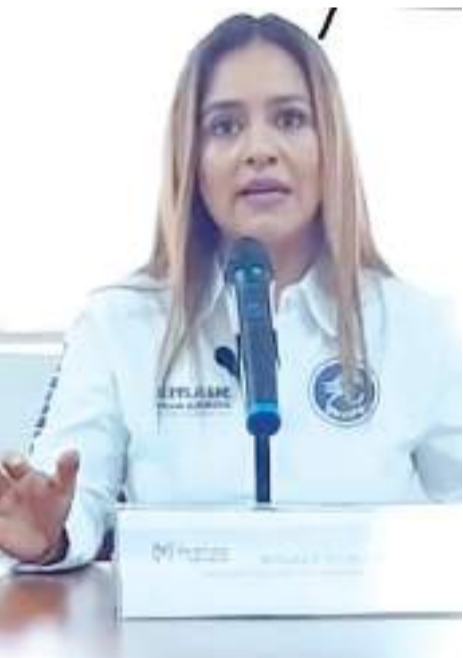
MEXICALI.- La legisladora ve oportunidad de que el PRI tenga buenos resultados en 2027 en BC.

Finalmente, reiteró que en materia de competitividad es importante trabajar de la mano con las autoridades en temas como el medio ambiente, conectividad, innovación, mercado laboral, seguridad, certidumbre jurídica, transparencia y gestión gubernamental, lo que permitirá no solo atraer mayor inversión, sino también impulsar el talento y las empresas.