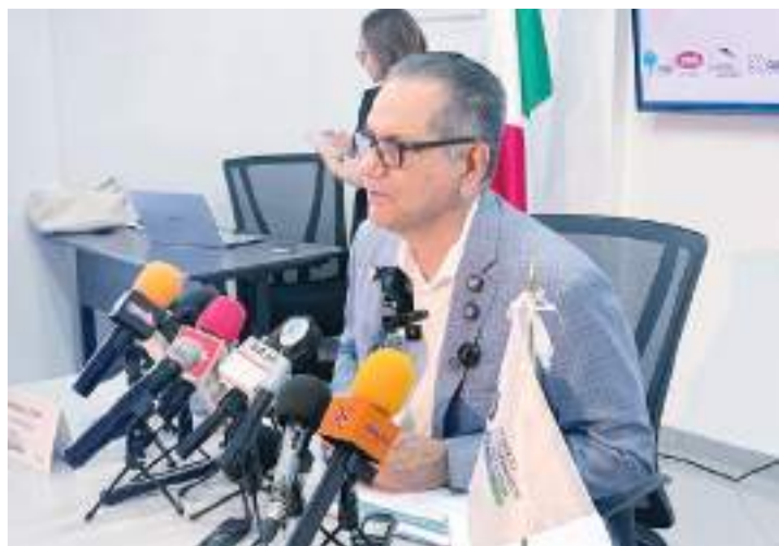
MEXICALI.- Es inútil la creación de una unidad para investigar a policías vinculados al crimen organizado dijo el líder del CEE.