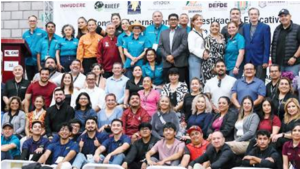
Se llevó a cabo la clausura del IV Congreso Internacional.