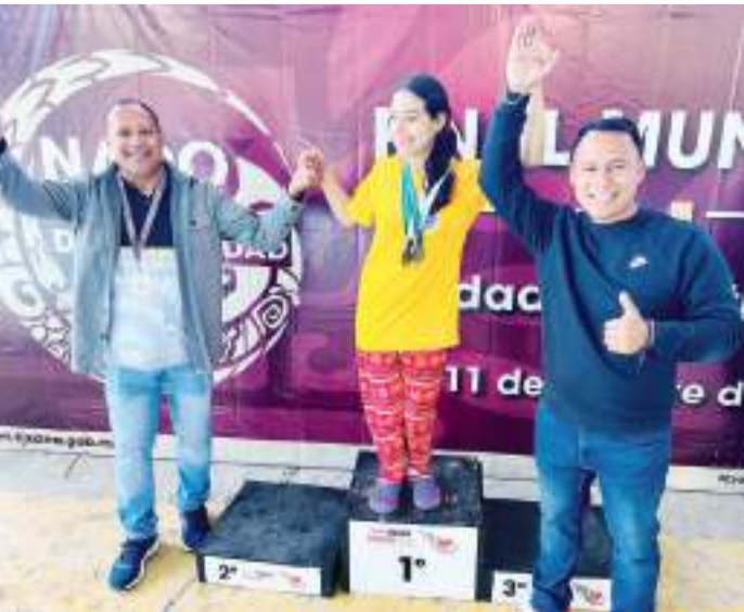
La competencia se realizó en la alberca de la Unidad Deportiva Crea.

Con este evento, el XXV Ayuntamiento de Tijuana reafirma su compromiso con la inclusión, la equidad y el fortalecimiento de programas deportivos que promuevan el desarrollo integral de la comunidad.