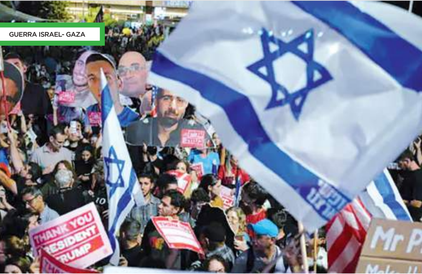
GUERRA ISRAEL- GAZA