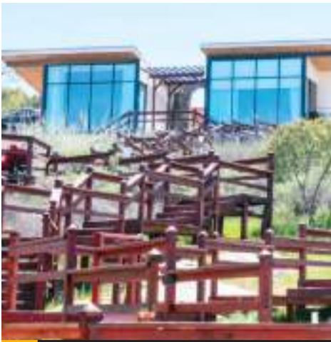
ENSENADA.- Este municipio concentra el 40% de los restaurantes en Baja California.