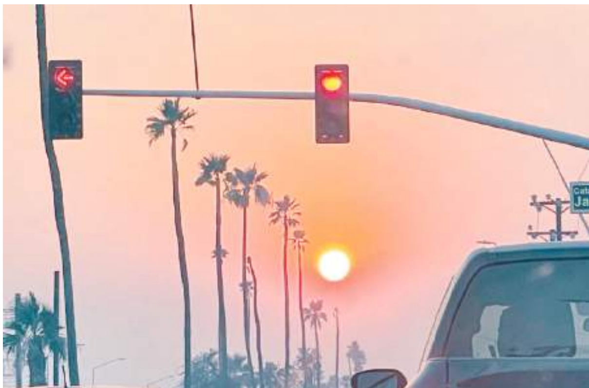
MEXICALI.- Urge modernizar los semáforos en la ciudad, aunque es necesario una gran inversión dijo el titular de la DMM.

El plan contempla iniciar en la zona de Calzada Cetys y calle Novena, donde los semáforos no están centralizados y la carga vehicular es alta. La inversión varía por sector, pero en algunos casos supera los 40 millones de pesos, debido al alto costo de los equipos. Tan solo el controlador, considerando el “cerebro” del semáforo, cuesta entre 600 mil