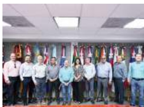
MEXICALI.- Impulsar el desarrollo y competitividad de BC, tarea primordial para el sector maquilador.

Según estudios internacionales como el de la Asociación de Pediatría Canadiense y la Organización Mundial de la Salud (OMS), en México los niños de siete años ven alrededor de cinco programas de televisión al día, pasan entre siete u ocho horas diarias en las pantallas y, en vacaciones hasta 15 horas; mientras los adolescentes pasan 12 horas diarias en sus celulares.