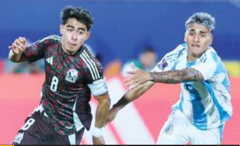
México fue eliminado a manos de Argentina en los cuartos de final.