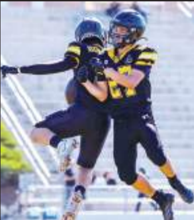
La jornada correspondió a la actividad de la Conferencia Baja California.