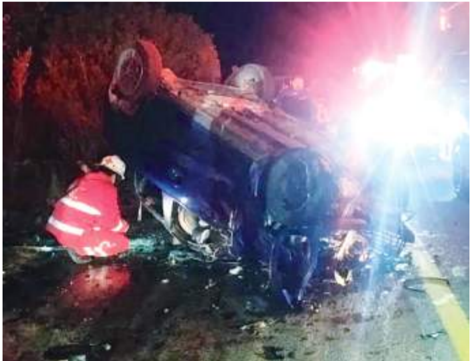
ENSENADA.- Personal de Bomberos realizó la extracción del cuerpo, mismo que fue entregado a SEMEFO.

Nacional, que fungió como primer respondiente.