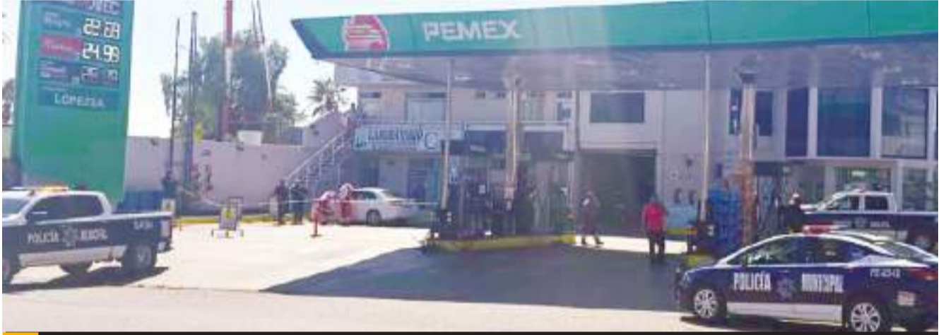
ENSENADA.- Es urgente replantear las acciones contra la inseguridad, señaló el Comité Ciudadano de Seguridad Pública de Ensenada.

el último estudio para 2024, la cifra negra es del 89.9% en este municipio. Mientras nueve de cada diez delitos no se denuncian (o no llegan a la etapa de juicio y castigo), no se puede decir que hay una mejora estadística real. “Por ello, exigimos a las autoridades municipales se solicite de inmediato la intervención del Secretario de Seguridad y Protección Ciudadana, Omar García Harfuch, para que acuda a Ensenada e implemente el cambio de estrategia que se está aplicando a nivel federal, con una visión de coordinación e inteligencia”, enfatizó. Finalmente, solicita que las corporaciones estatales y federales ya presentes en el municipio FGE, FGE, GN, SEDENA, SEMAR implementen acciones realmente disuasivas del delito.