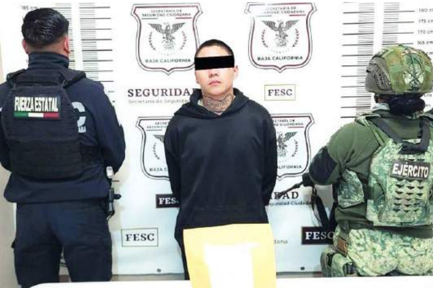
ENSENADA.- El individuo mostró signos de nerviosismo.

TRAÍA ADEMÁS 19 ENVOLTORIOS CON METANFETAMINA