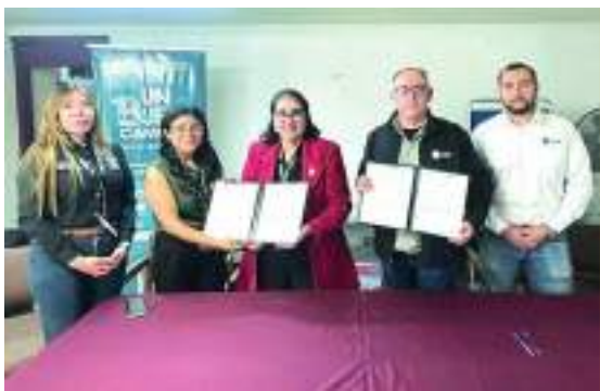
TIJUANA.- El IMCAD y Promotora Ambiental GEN firmaron un acuerdo de colaboración para fortalecer la prevención y atención de las adicciones en la ciudad.

más de 800 personas. El Gobierno Municipal continúa trabajando de la mano con la ciudadanía en acciones que contribuyen al mejoramiento de la calidad de vida de las familias tijuanaenses.