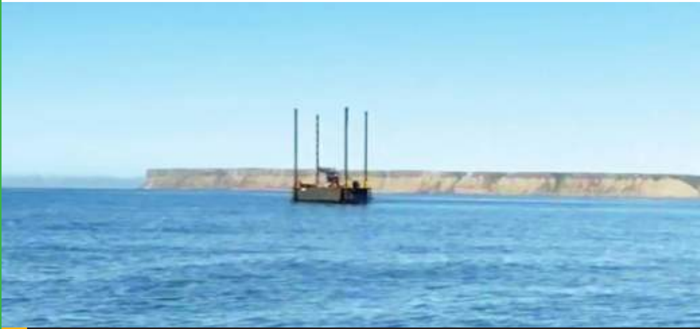
Pescadores ribereños denuncian derrame de diésel tras el desplome de la plataforma gasera instalada en Punta Colonet.

Los ribereños, afirmaron que la estructura apareció sin previo aviso y que desde su colocación ha comenzado a afectar pues obstruye sus artes de pesca y las rutas de navegación que utilizan diariamente.