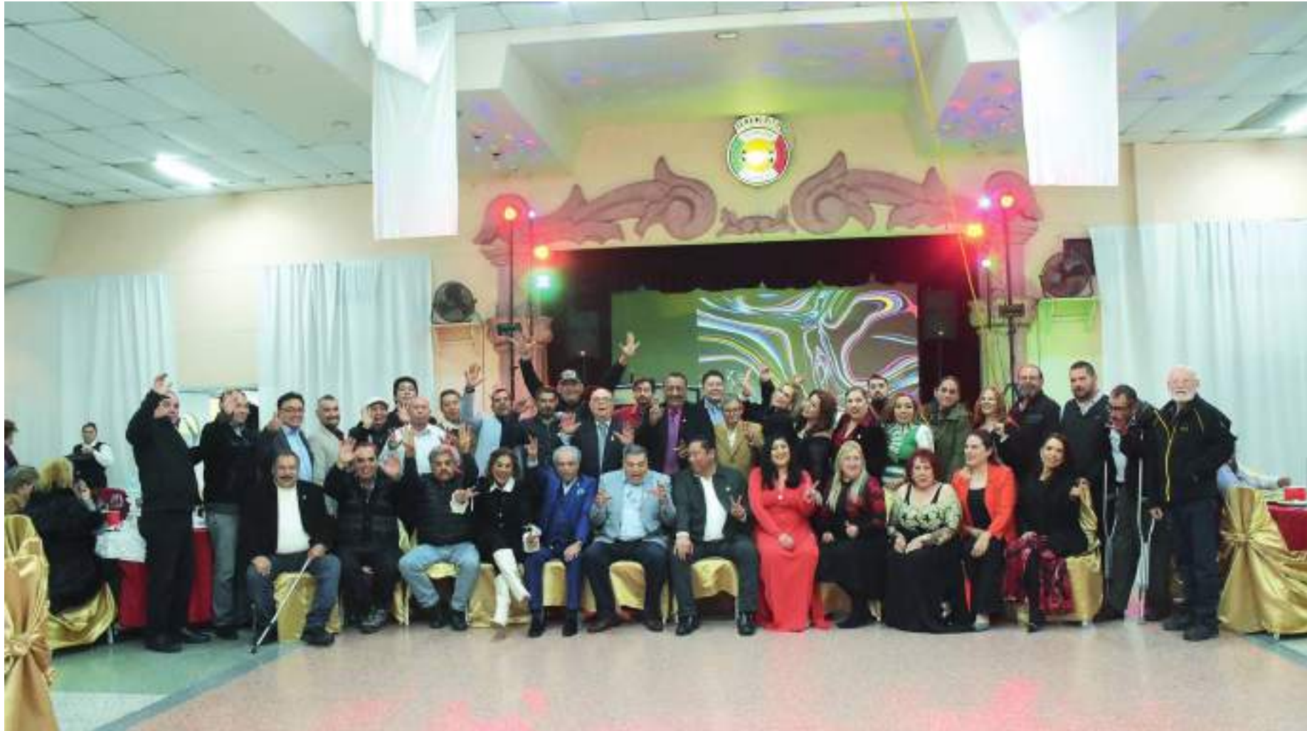
Los socios del Benemérito Centro Mutualista de Zaragoza, realizaron su tradicional convivio decembrino.