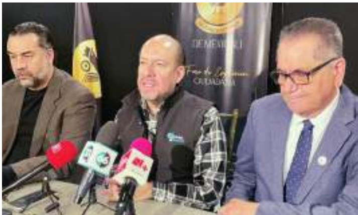
MEXICALI.- Otra semana bloqueada la garita será mortal, advirtieron el CCE e INDEX.