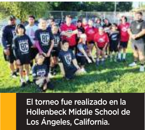
El torneo fue realizado en la Hollenbeck Middle School de Los Ángeles, California.