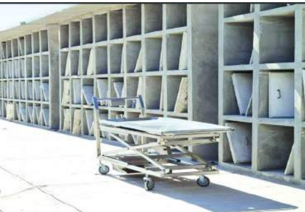
MEXICALI.- A seis meses de su apertura, son pocos los cuerpos identificados en el centro de resguardo.