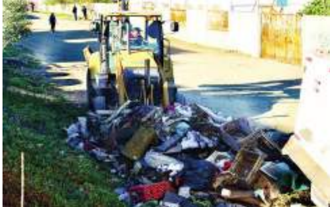
TIJUANA.- Con la recolección de 40 toneladas de basura pesada se beneficia a 12 mil 300 residentes de colonias de las delegaciones La Presa Este, La Presa Abelardo L. Rodríguez, y Cerro Colorado.

do positivamente a más de 7 mil 500 personas. Los trabajos de este lunes concluyeron con la recolección de 20 toneladas de basura pesada en la calle José López Portillo, en la colonia Presidentes, beneficiando a