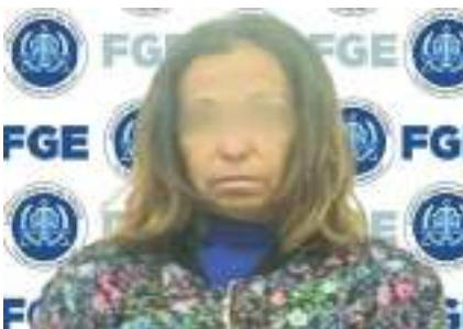
ENSENADA.- La imputada llegó al hogar de la víctima, tomó un martillo y un hacha con la intención de agredirla.