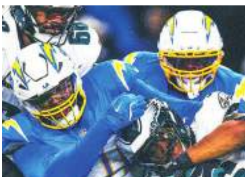
Los Chargers forzaron un cierre dramático que culminó en tiempo extra.

Los campeones defensores del Super Bowl sufrieron su tercera derrota consecutiva, su peor racha de la temporada, y pusieron su marca en 8-5.