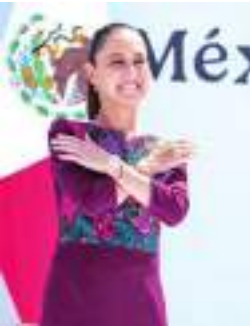
TIJUANA CLAUDIA SHEINBAUM PARDO...

Una de las 67 personas más elegantes a nivel mundial en 2025.