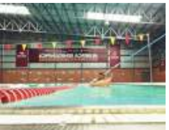
La Alberca Semiolímpica permanecerá cerrada del 1 de diciembre de 2025 al 1 de enero de 2026.

Inmudere invitó a seguir sus redes oficiales para mantenerse informado sobre la reapertura y disfrutar nuevamente de este espacio.