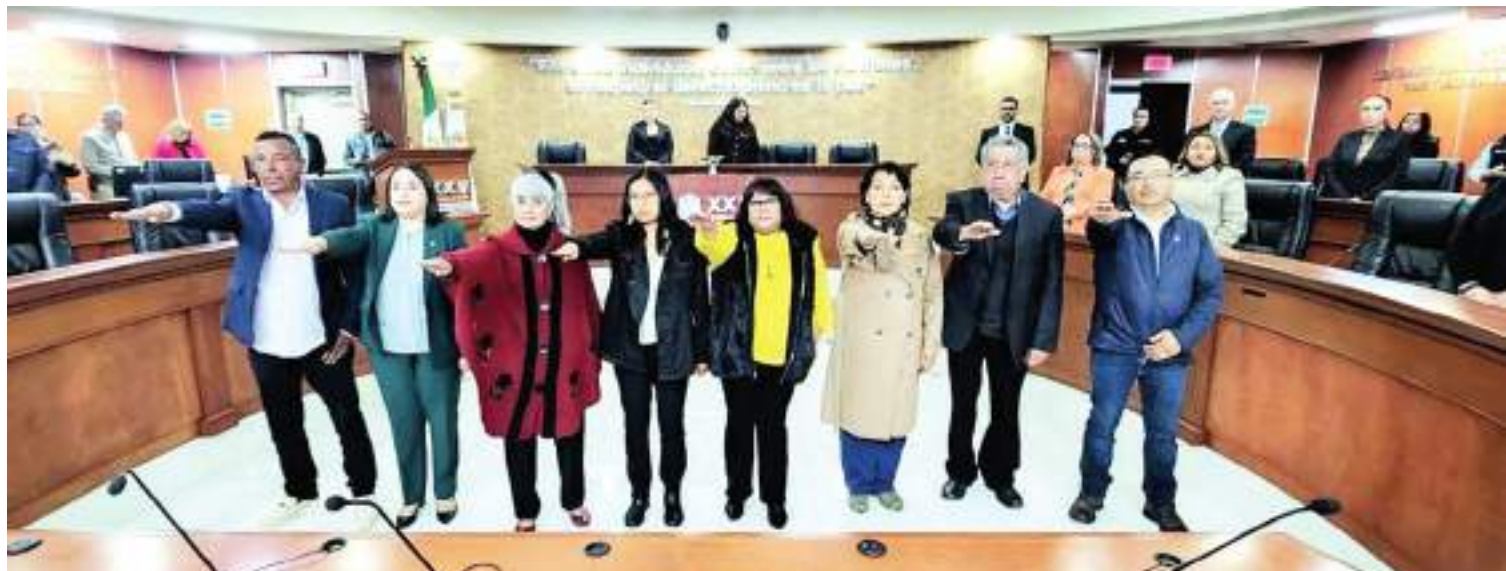
MEXICALI.- Con la toma de protesta de los integrantes del Consejo Ciudadano de búsqueda, se inicia una nueva etapa en las acciones de localización de desaparecidos.

parecidas, organizaciones civiles y espacios especializados en derechos humanos, quienes desempeñarán su labor de manera honorífica. Tras la toma de protesta de sus integrantes, el Consejo Estatal Ciudadano queda formalmente instalado para fortalecer los trabajos de búsqueda de búsqueda en Baja California.