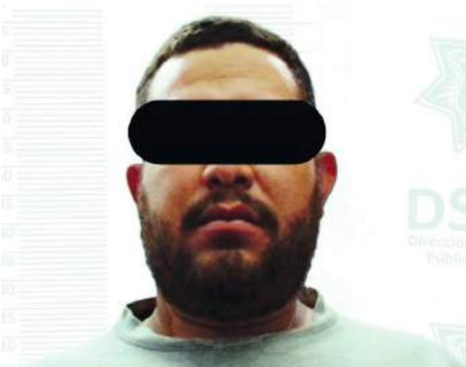
ENSENADA.- Los oficiales solicitaron apoyo de paramédicos.