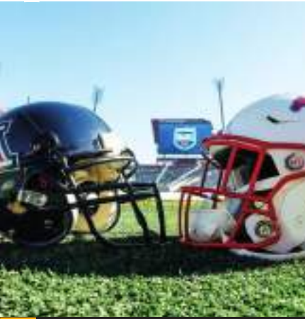
Quedaron confirmados los equipos que participarán.

aparición de los Mustangs fue memorable: fueron derrotados 46-45 en 1980 por los Cougars de BYU sin tiempo restante. El backfield de SMU ese año era conocido como el “Pony Express” e incluía al legendario dúo de corredores Eric Dickerson y Craig James. Arizona y SMU se han enfrentado dos veces. SMU ganó el primer enfrentamiento por 29-7 durante la temporada de 1938. Arizona venció a SMU, tercero en la clasificación, por 28-6 en 1985.