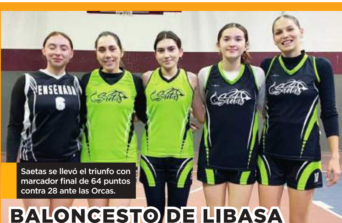
Saetas se llevó el triunfo con marcador final de 64 puntos contra 28 ante las Orcas.