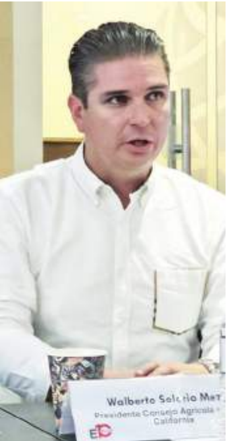
ENSENADA.- El acompañamiento del CNA permitió presentar propuestas sustentadas.