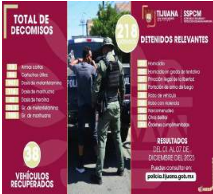
TIJUANA.- Más de 200 personas detenidas por la comisión de algún delito, logró la policía municipal de Tijuana, del 1 al 7 de diciembre.

78.3 gramos de metanfetamina y 150 gramos de marihuana localizados durante patrullajes preventivos y operativos focalizados. De igual manera, con el firme compromiso de proteger el patrimonio de las y los tijuanaenses, se logró la detención de 28 personas por robo de vehículo y la recuperación de 38 unidades con reporte de robo. La denuncia ciudadana es una herramienta fundamental para la atención inmediata y efectiva de cualquier emergencia o situación de riesgo. Por ello, la colaboración de la comunidad al reportar oportunamente a la línea 089, 9-1-1, o a través del Botón de Emergencias permite a los cuerpos de seguridad actuar con rapidez, dirigir los recursos de manera precisa y prevenir que los hechos delictivos escalen. Gracias a estos reportes, se fortalecen las acciones policiales y se contribuye directamente a la construcción de entornos más seguros para todas y todos. La Secretaría de Seguridad y Protección Ciudadana Municipal reitera su compromiso de fortalecer los esquemas preventivos y de combate al delito, mediante acciones coordinadas que contribuyan a la recuperación de la paz y el orden en la ciudad, así como la intensificación de labores de proximidad y prevención del delito. (scg)