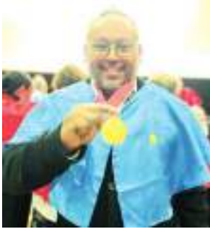
TIJUANA ENRIQUE CHIU...

“En su primer año en el cargo, la Presidenta ha lla-