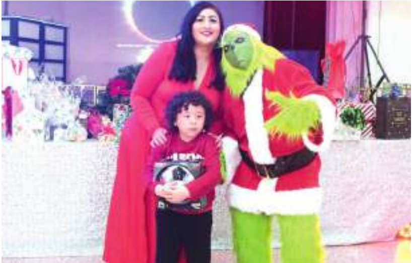
Entregaron regalos a los niños.