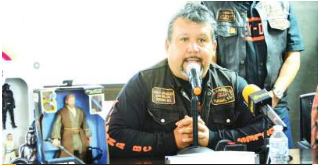
TIJUANA.- Los motociclistas y la población en general sigue apoyando a la causa con la entrega de juguetes no bélicos y sin envolver.