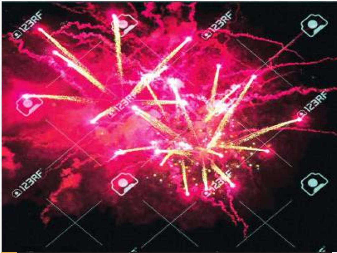
MEXICALI.- Solo una empresa en la ciudad está autorizada para vender cohetes dijo la alcaldesa.